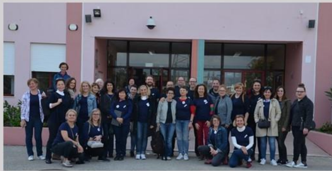
FUTURE CLASSROOM LAB