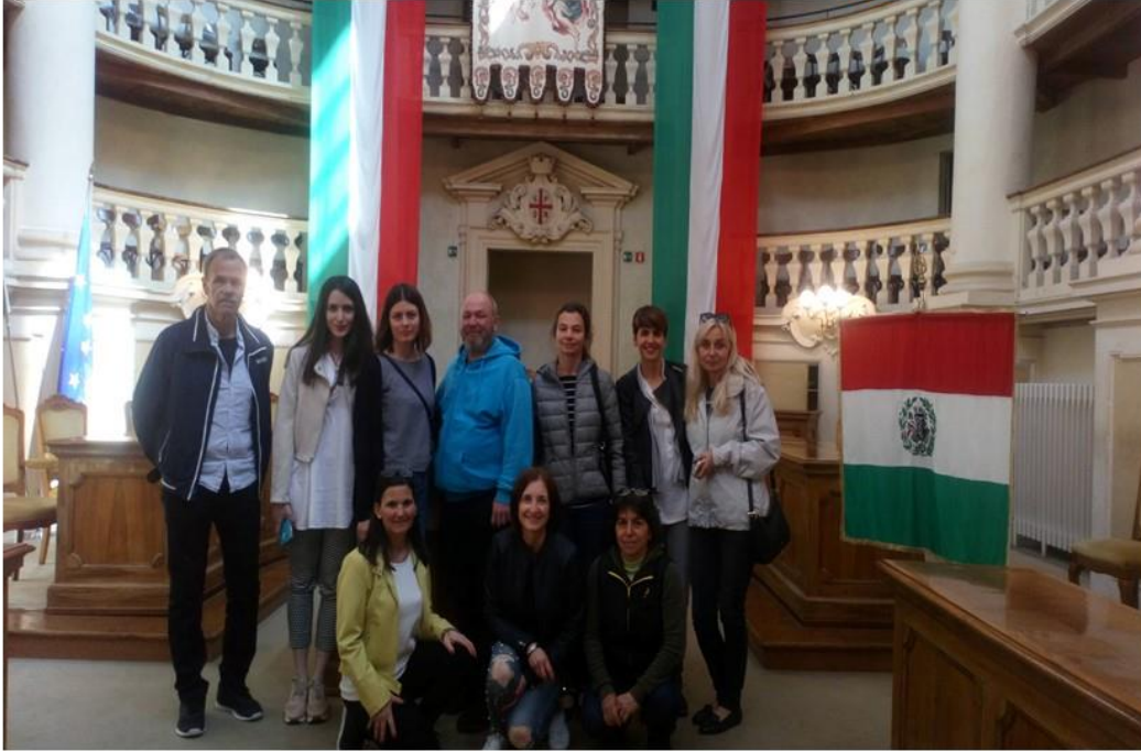
Muzeum trzykolorowej flagi i powstania zjednoczonego państwa