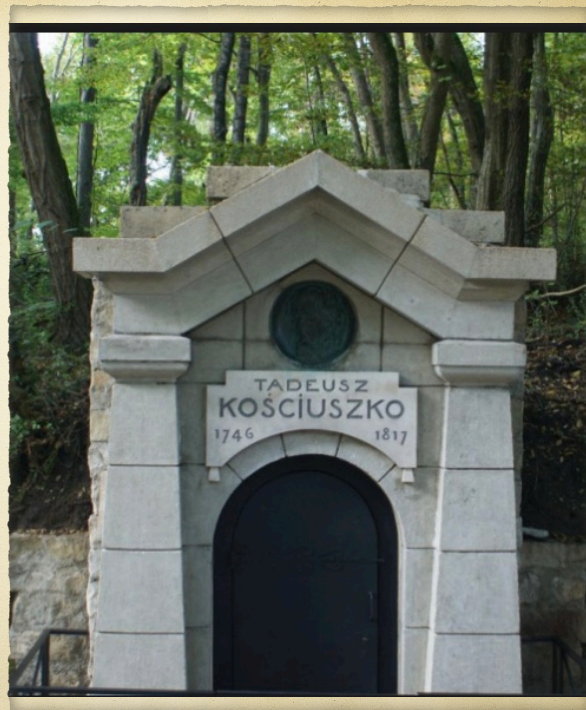
Pomnik-mauzoleum gen. Tadeusza Kosciuszki w Sorques ( Francja )