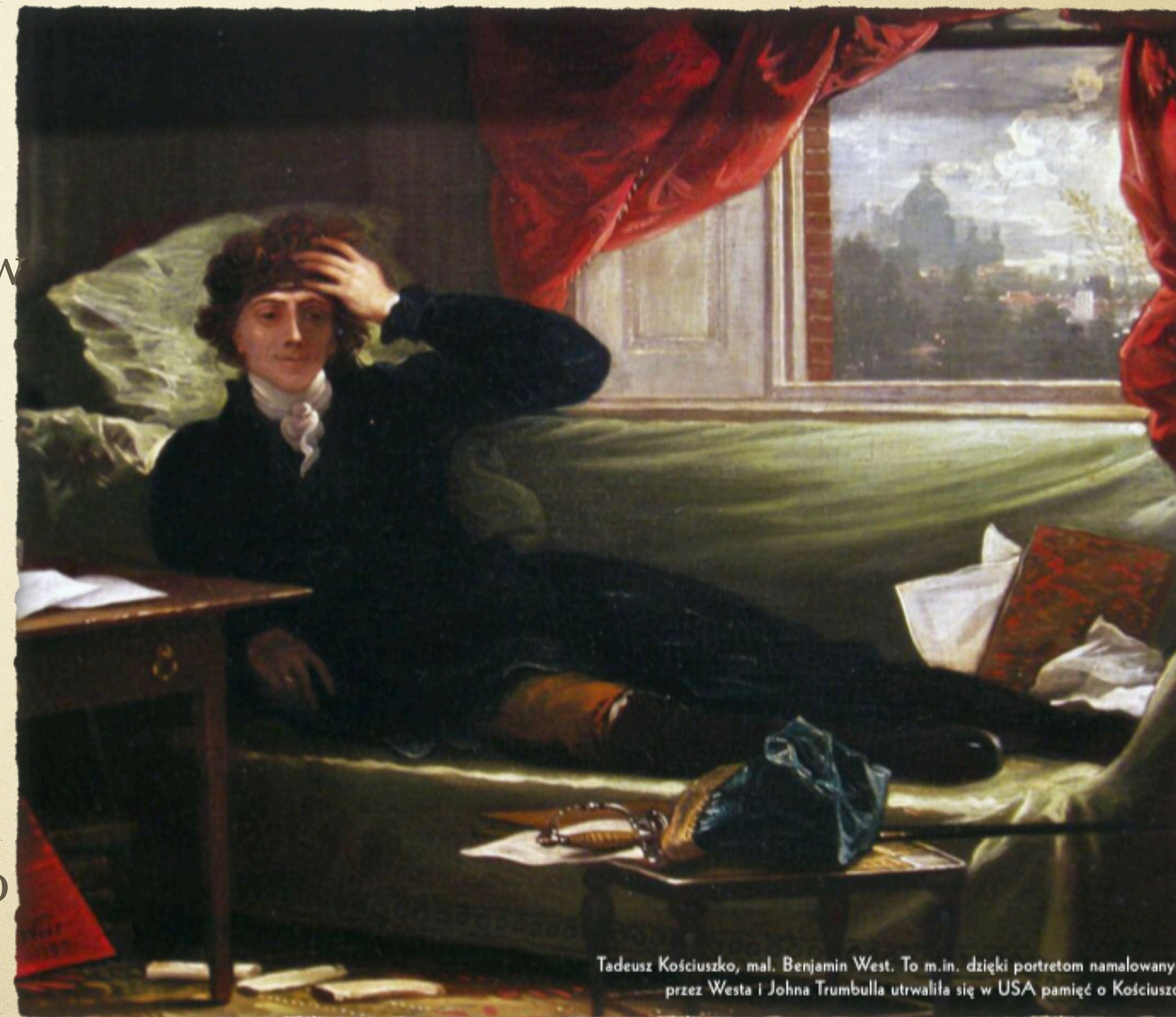
Tadeusz Kościuszko, mal. Benjamin West. To m.in. dzięki portretom namalowanym przez Westa i Johna Trumbulla utrwaliła się w USA pamięć o Kościuszcze