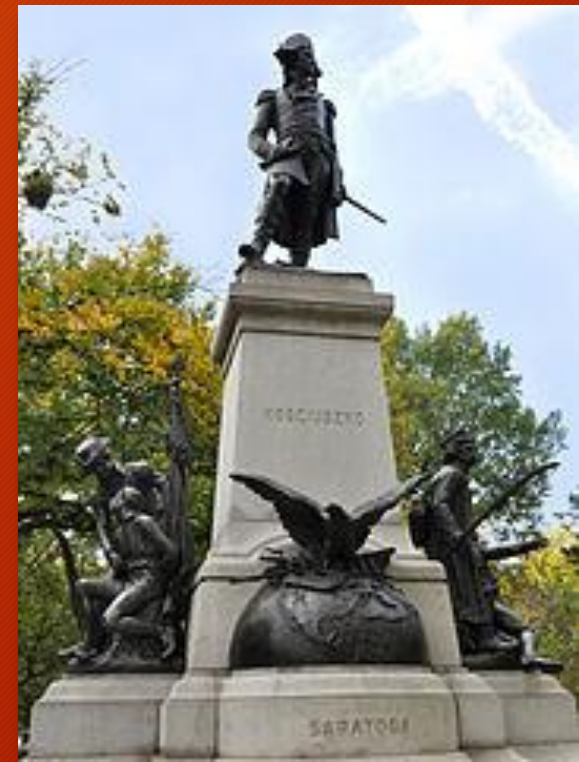
Pomnik Kościuszki w Waszyngtonie

16 listopada 2010 roku odsłonięto w Warszawie polską kopię pomnika.