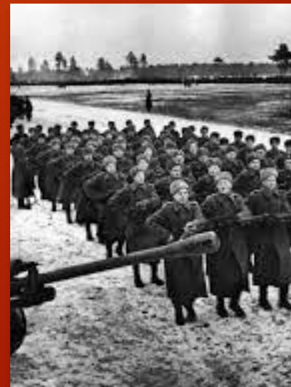
Czołg T-34 i żołnierze 1 Dywizji