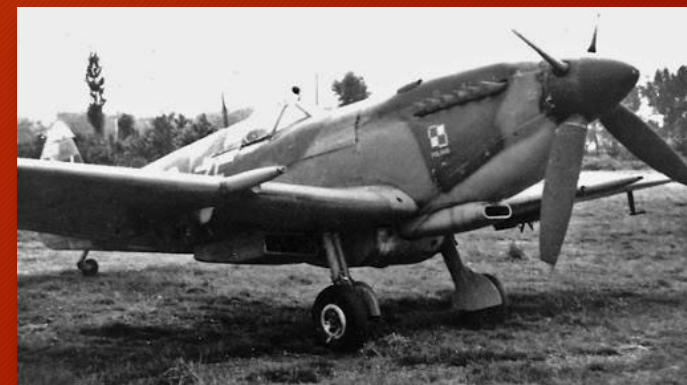
Myśliwiec Spitfire z polskim oznakowaniem