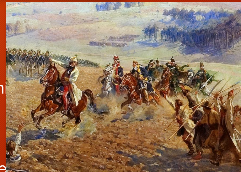
Fragment Panoramy Racławickiej

Losy Panoramy były bardzo burzliwe, po II wojnie światowej trafiła do Wrocławia. Przez wiele lat leżała w magazynach. Ostatecznie została odślonięta w specjalnie wybudowanej rotundzie we Wrocławiu w 1985 roku. Można ją tam podziwiać do dzisiaj, na żywo lub online ( https://mnwr.pl/category/oddzialy/panorama-raclawicka/ ).