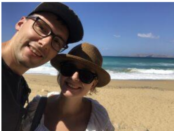
Plaża na przedmieściach Heraklionu

Nie jest tajemnicą, że Kreta jest gorącą i słoneczną wyspą, więc nie powinno dziwić, że taka jest też jej stolica. Może się zdarzyć, że w trakcie pobytu Heraklion okaże się najbardziej wietrznym ze wszystkich odwiedzanych miejsc. Przez to też odczuwalna temperatura może zdawać się niższą niż na południu. Niezależnie jednak od powyższego, na pewno lecąc do Heraklionu można liczyć na ciepło, bezchmurne niebo i brak opadów.