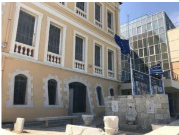
Muzeum Historii Krety

Heraklion słynie z muzeów. Jako stolica Krety, jednej z najistotniejszych wysp basenu Morza Śródziemnego, mieści gmachy muzeów historycznych, ale nie tylko. Na pewno za najśłynniejsze uchodzi tutejsze muzeum archeologii , które skupia się na przedstawianiu pamiątek po pierwszych osadach wyspy, datowanych nawet na siódme tysiąclecie przed naszą erą. Najwięcej uwagi poświęca jednak wytworzonej na Krecie kulturze minojskiej. Kolejną instytucją jest Muzeum Historii Krety , które opowiada nieco ogólniej o dziejach wyspy – aż po lata drugiej wojny światowej. Pokazuje też elementy kretańskiego folkloru. Inną propozycją, zwłaszcza dla rodzin z dziećmi, okaże się muzeum historii naturalnej .