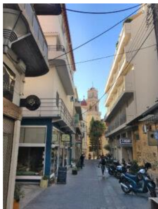
Typowa uliczka w Heraklionie