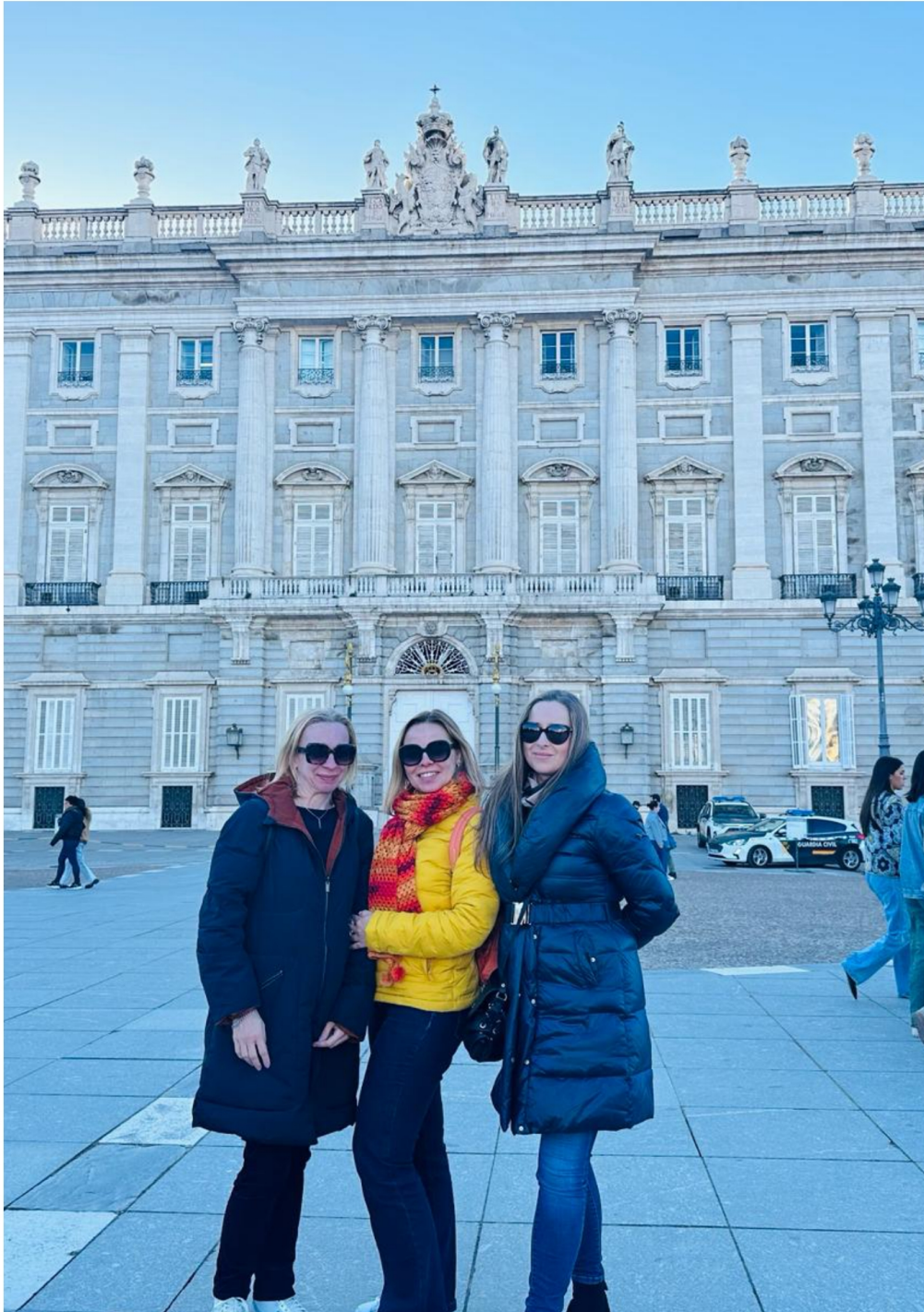
M a d r y t