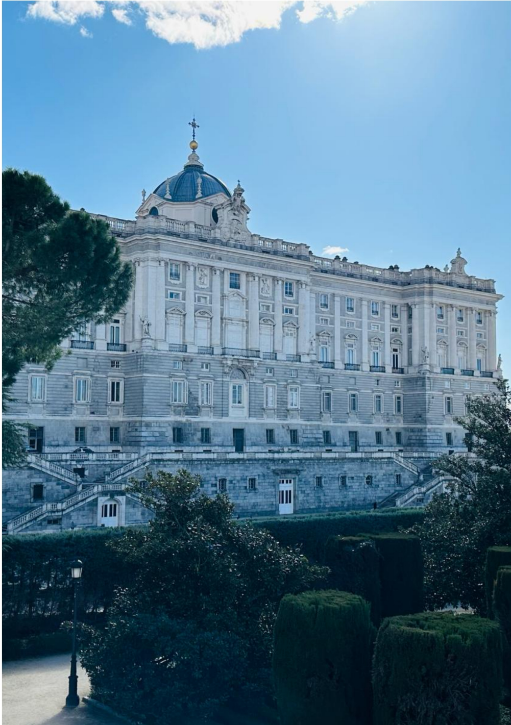
M a d r y t