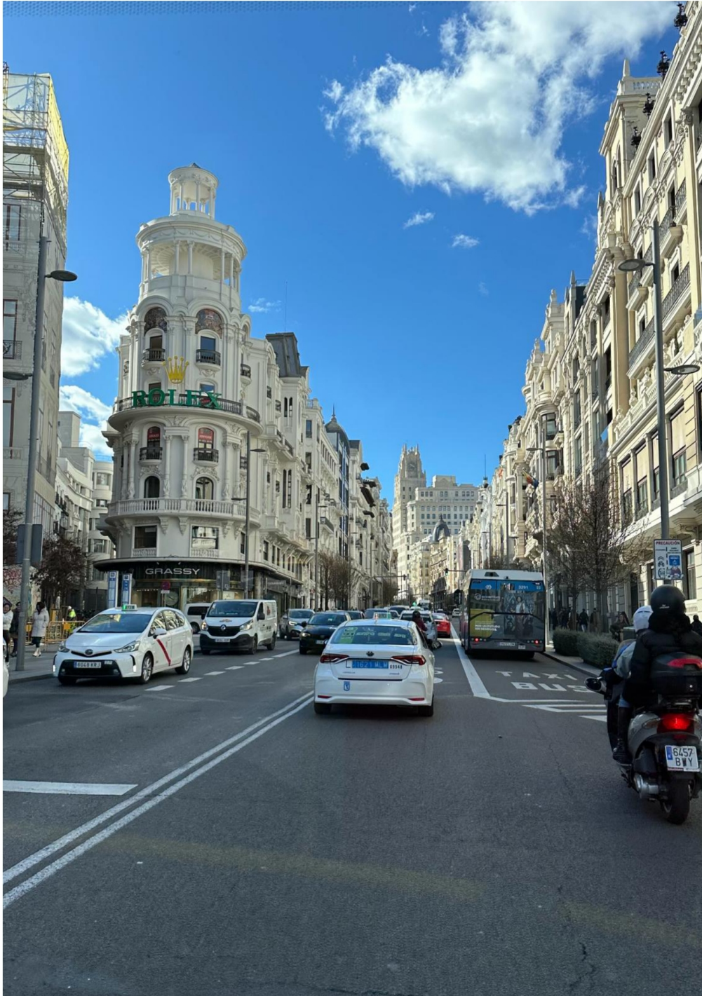
M a d r y t